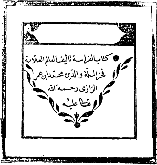
الصفحة الأولى من المخطوطة